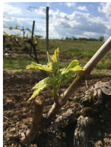
Stade 9 - 2 à 3 feuilles étalées

Au cours de la semaine écoulée les températures ont remonté de façon significative avec 14.4 °C en moyenne. Les températures devraient rester douces dans les jours à venir.