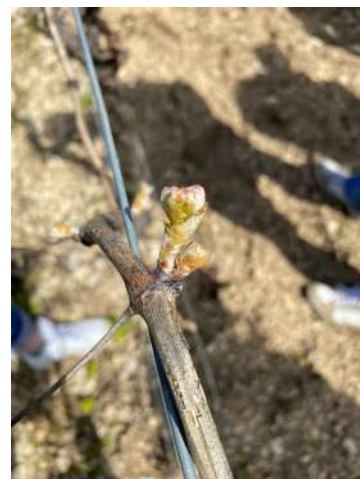
Pointe verte

Les températures sont restés stables avec 11.6° C en moyenne. Elles devraient rester douces dans les jours à venir (entre 8° C et 20° C).