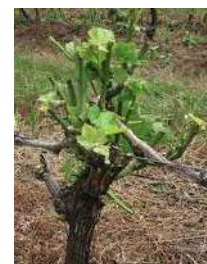
Dégâts de chevreuil sur vigne

Retrouver les infos en cliquant sur ce lien :